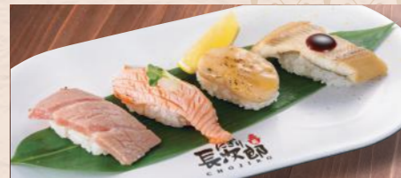
炙りづくし(上) 税込1,210円 大とろ・サーモン・貝柱(たいらぎ)バター醤油・煮穴子