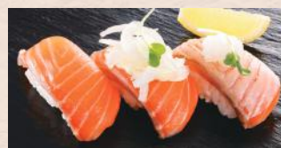
サーモン三味 税込570円