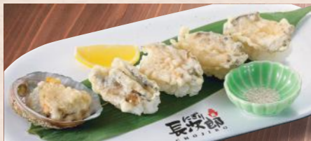
煮あわび天ぷらづくし 税込1,200円