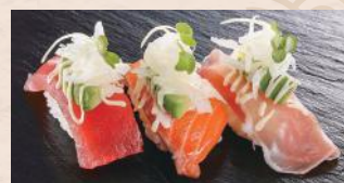
アボカド三味 税込480円