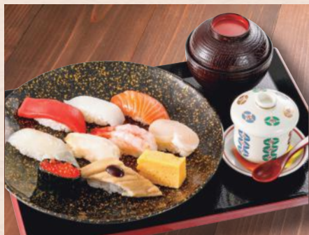
にぎり盛り「伏見」 税込2,480円