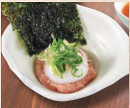
炙りまぐろユッケ一品 税込580円