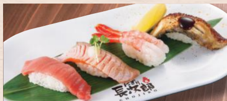
人気者づくし 税込1,160円