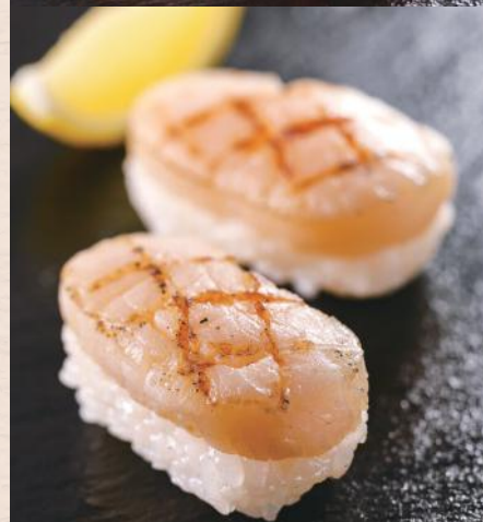
炙り貝柱(たいらぎ)