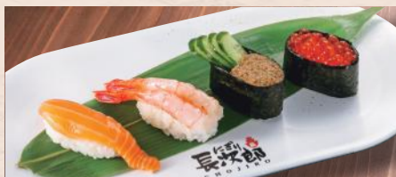
北海づくし 税込1,070円