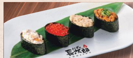
軍艦づくし 税込630円 シーサラダ軍艦・いくら軍艦・ツナ軍艦・納豆軍艦