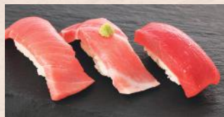
本まぐろ三味 税込1,030円