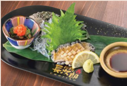
活あわびお造り 税込1,280円