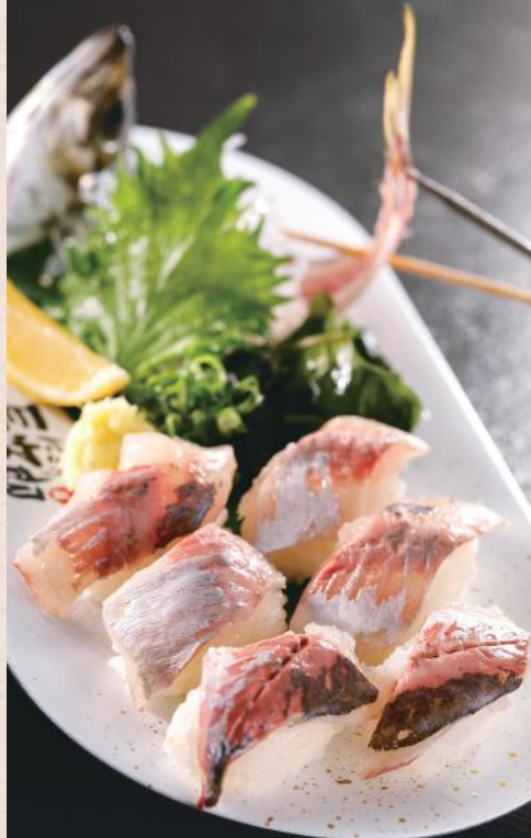
名物 泳がし鰯一匹にぎり 税込1,100円