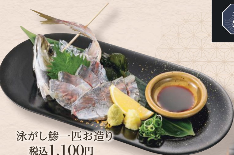
泳がし鰯一匹お造り 税込1,100円