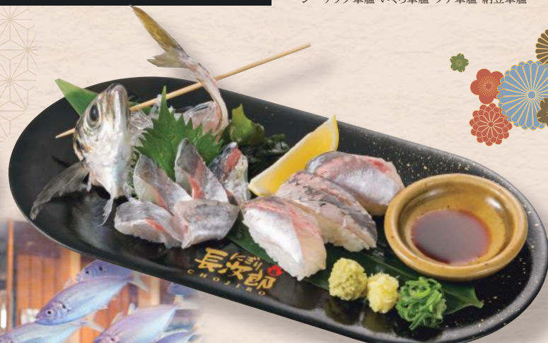
泳がし鰯一匹にぎり&お造り 税込1,100円