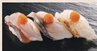
小豆島ボン酢三味 税込650円