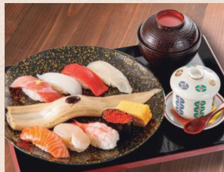
にぎり盛り「八坂」 税込3,280円