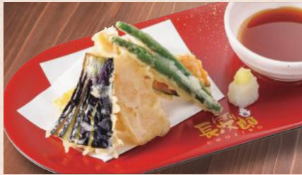
野菜天ぷら盛り合わせ 税込680円