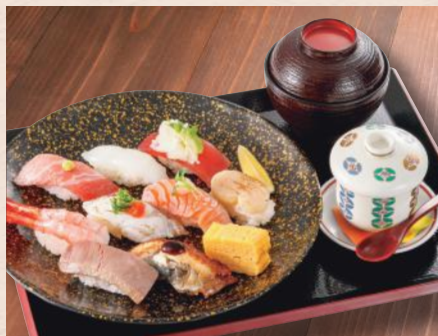
にぎり盛り「鞍馬」 税込2,780円