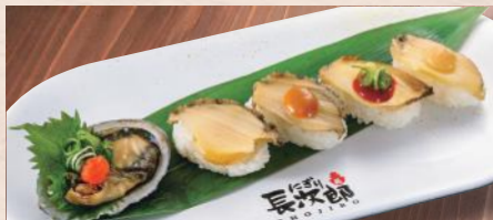
煮あわびづくし 税込980円