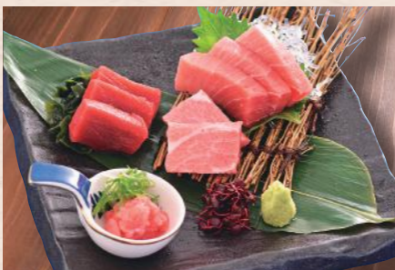
本まぐろ造り盛り 税込1,580円