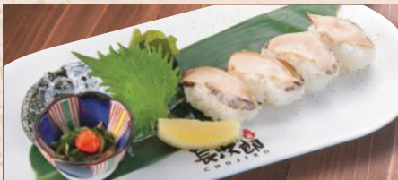
まると活あわび 税込1,280円