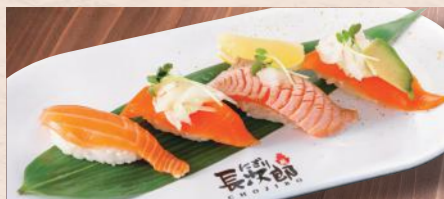
サーモンづくし 税込730円