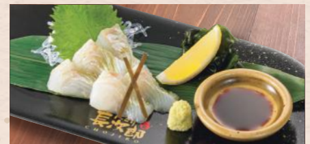
ひらめ昆布ノ宇治抹茶仕立てお造り 税込880円