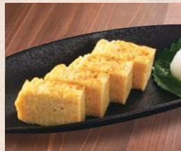
熱々玉子の付きだし 税込380円