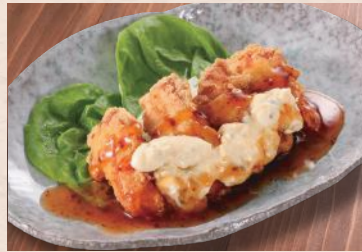
国産とり天南蛮 税込680円