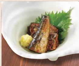
いわし煮付け一品 税込300円