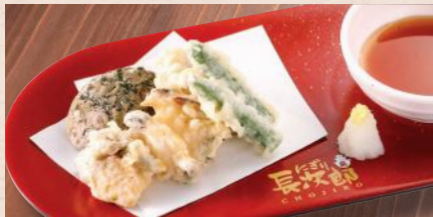
煮あわび天ぷら一品 税込980円