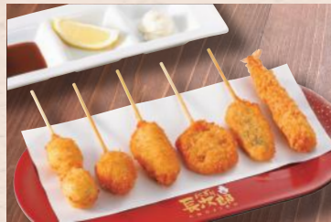
海老フライと揚げ盛り 税込790円