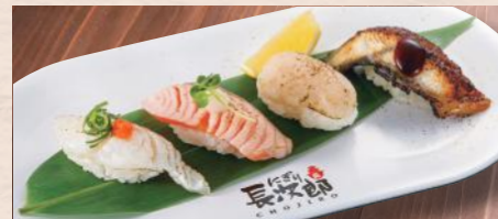
炙りづくし 税込920円 鯛・サーモン・貝柱(たいらぎ)・うなぎ