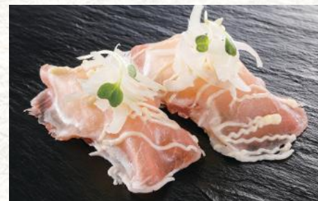
生ハムオニオン 240円