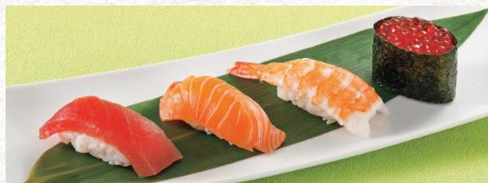
わさび抜きCセット 1,030円