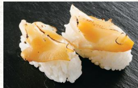
つぶ貝バター醤油 440円