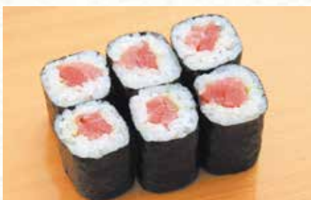
本まぐろとろ鉄火 830円