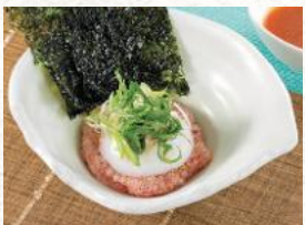
炙りまぐろユッケ 630円