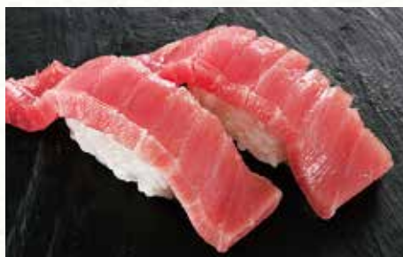
本まぐろ中とろ 800円