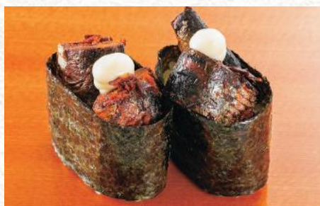
いわし煮付軍艦(マヨ) 320円