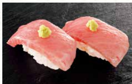
本まぐろ大とろ 1,030円