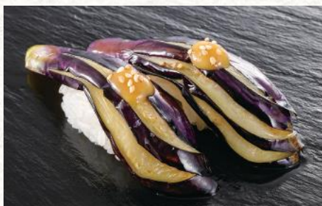
揚げなす田楽(白) 240円