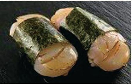
ほたてバター磯部巻 800円