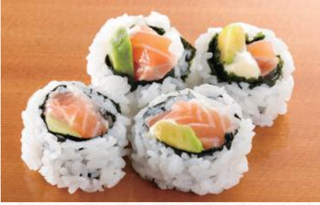
サーモンアボカド巻 540円