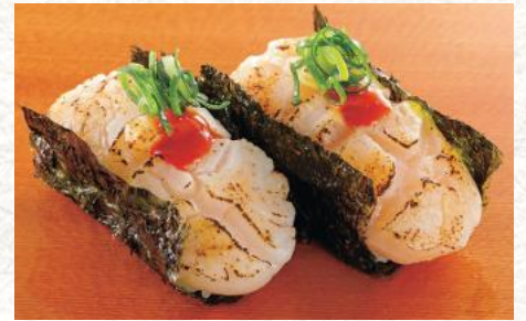
炙りほたての海苔包み 800円