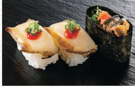
煮あわび旨辛コチュジャン 700円