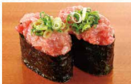
本まぐろねぎとろ軍艦 800円