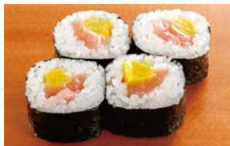
本まぐろとろたく巻 830円