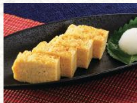
熱々玉子の付きだし 430円