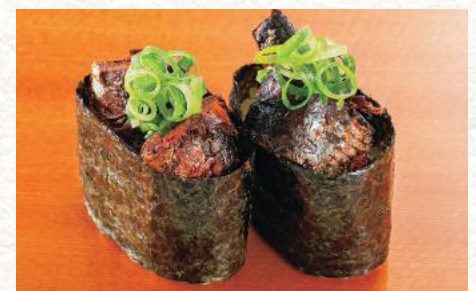
いわし煮付軍艦(ねぎ) 320円