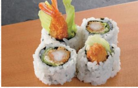
海老フライロール 440円