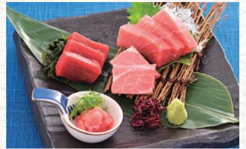
本まぐろお造り 1,850円