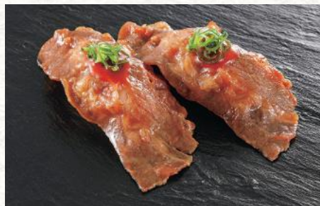
炙り牛カルビ 旨辛 320円