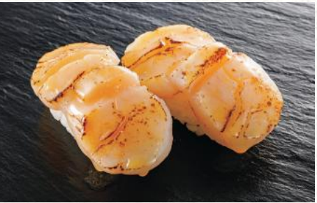
ほたてバター醤油 800円