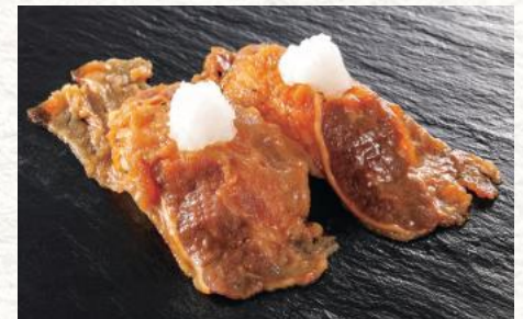
炙り牛カルビ おろし 320円