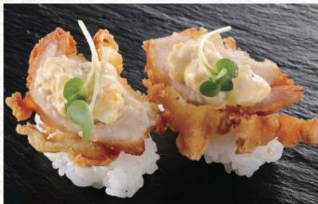
国産とり天(タルタル) 320円