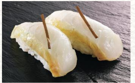
ひらめ昆布メ(宇治抹茶仕立て) 600円