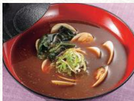
はまぐり赤だし 480円