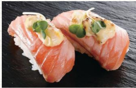
サーモンタルタル 540円