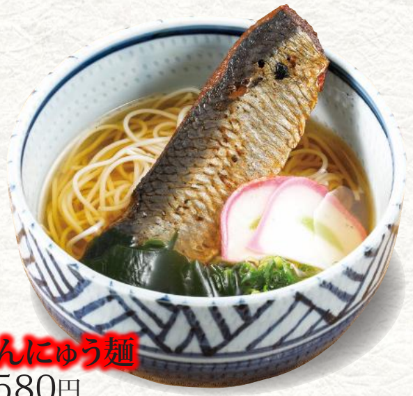
にしんにゅう麺 580円