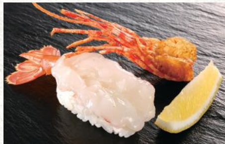
ぼたん海老 (一貫) 800円