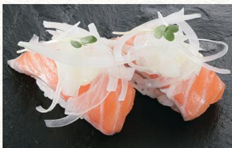
オニオンサーモン 510円