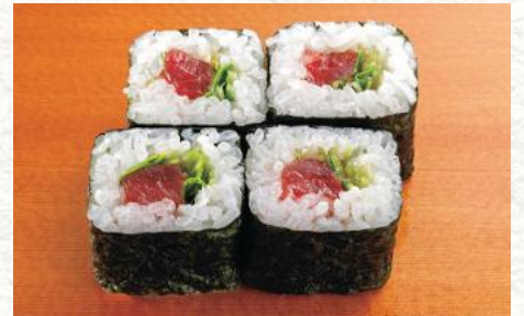
かいわれまぐろ巻 380円