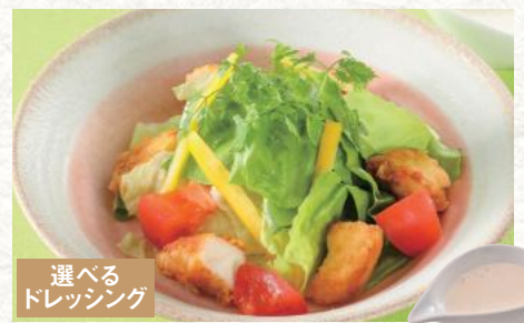
選べる ドレッシング