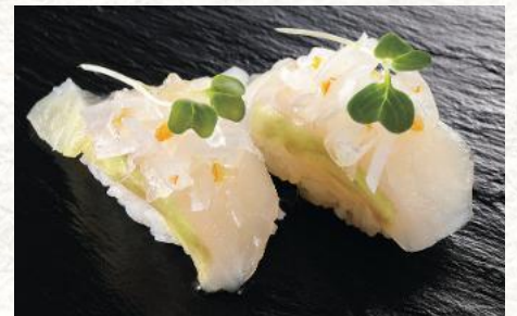
ひらめ昆布メ(宇治抹茶仕立て)かんきつ 600円