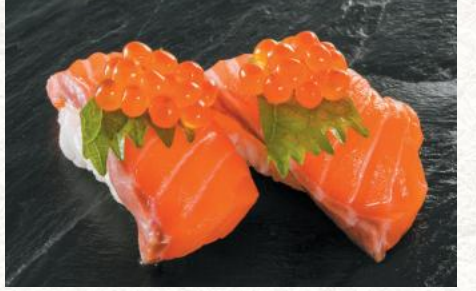
サーモンいくら のせ 600円