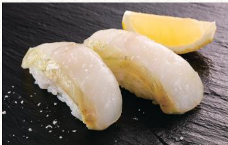
ひらめ昆布メ(宇治抹茶仕立て)レモン塩 600円