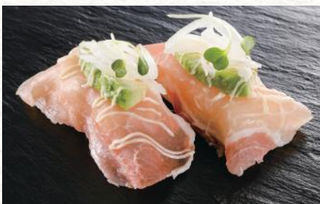
生ハムアボカド 320円