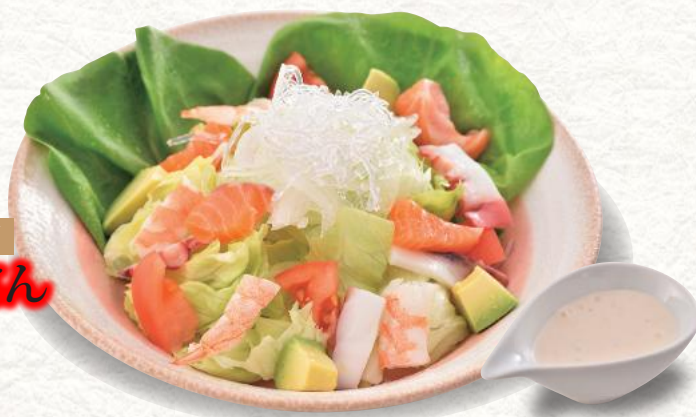
選べるドレッシング お寿司屋さん サラダ 630円