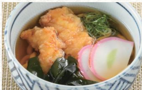
国産とり天うどん 530円