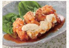
国産とり天南蛮 680円