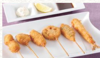
海老フライと串揚げ盛り 930円