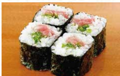
本まぐろねぎとろ巻 830円