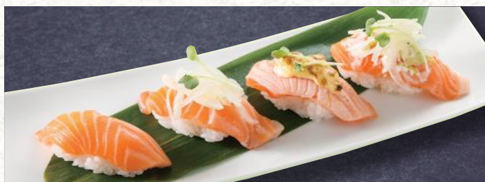
サーモンづくし 1,050円