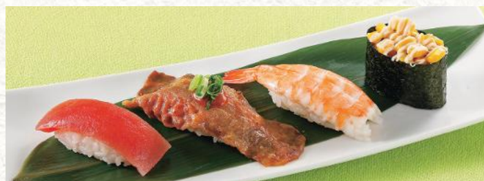
わさび抜きAセット 610円