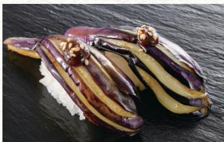
揚げなす田楽(赤) 240円