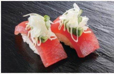
アボカドまぐろ 440円