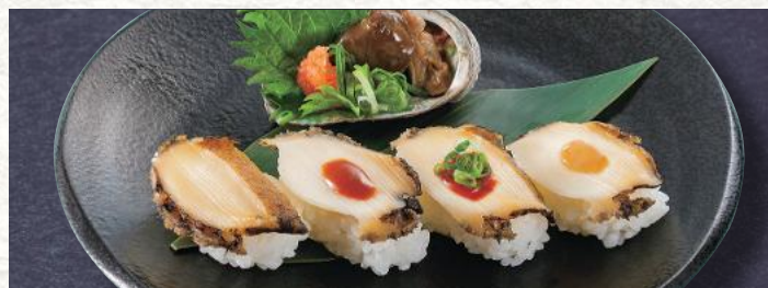
煮あわびづくし 1,400円