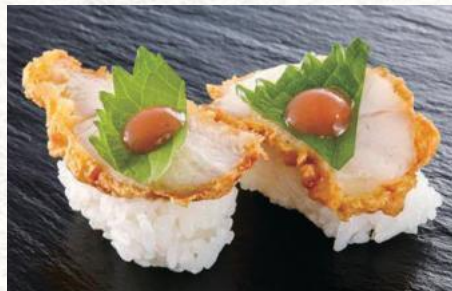
国産とり天(梅しそ) 320円