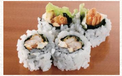
国産とり天南蛮巻 440円