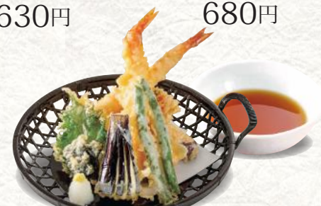
海老天ぷら盛り合わせ 1,030円