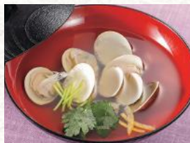
はまぐりお吸い物 480円