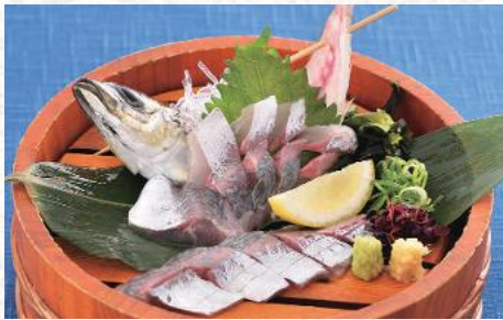
泳がし鱈一匹お造り 1,430円