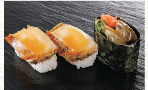
煮あわびバター醤油 700円