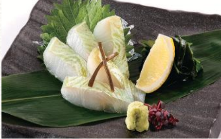
ひらめ昆布メお造り(宇治抹茶仕立て) 1,130円