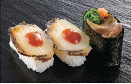
煮あわび照りマヨ 700円