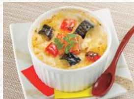
長次郎グラタン 630円