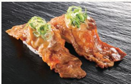
炙り牛カルビ 照りマヨ 320円