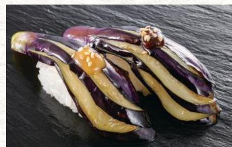
揚げなす二色田楽 240円