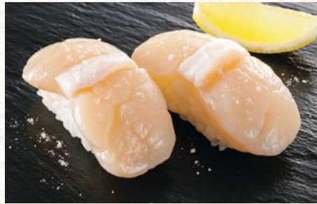
ほたてレモン塩 800円