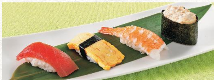
わさび抜きBセット 570円