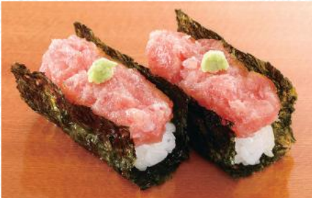
まぐろたたき海苔包み 380円