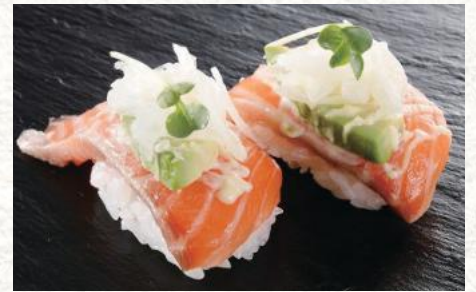
アボカドサーモン 540円