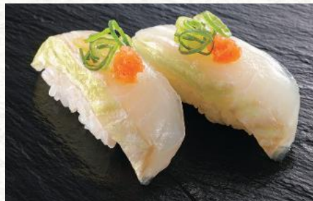
ひらめ昆布メ(宇治抹茶仕立て)葱もみじ 600円