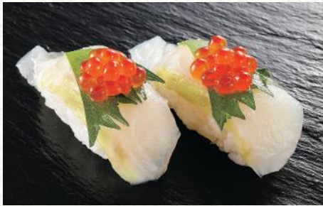
ひらめ昆布メ (宇治抹茶仕立て) いくらのおせ 680円