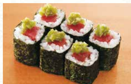
本まぐろ涙鉄火 600円