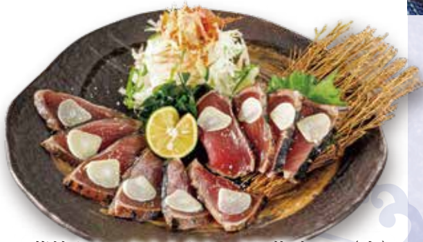
藁焼きかつおたたきたっぷり薬味のせ(大) 税込1,480円