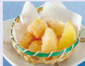
マンボウ唐揚げ 税込480円