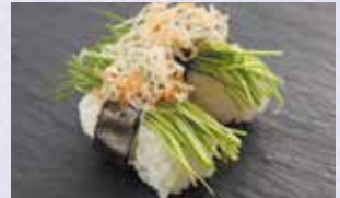
芽ねぎ糸花かつお 税込290円