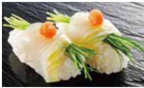
ひらめ昆布メ宇治抹茶仕立て 芽ねぎ 税込580円