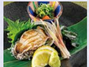
活あわびお造り薬味添え 税込790円