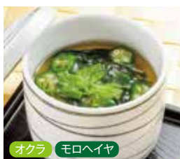
オクラ モロヘイヤ 季節の茶碗蒸し 税込430円