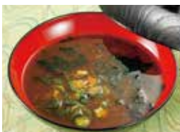
おくらモロヘイヤと 鳴門わかめの赤だし 税込380円