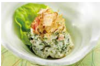
あおさの 入った 季節の ポテトサラダ 税込380円