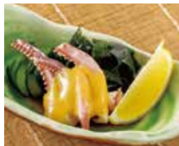
するめげそと 鳴門わかめの酢の物 税込480円