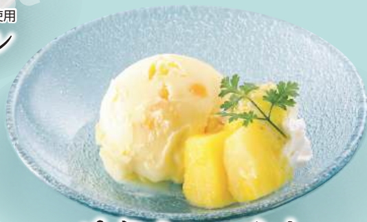
パインシャーベット 税込380円