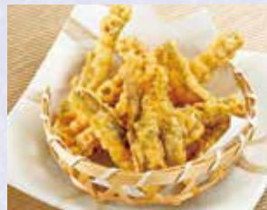
瀬戸内産おつまみチーズ海苔天 税込380円