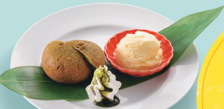
抹茶もちりドーナツアイス添え 税込430円