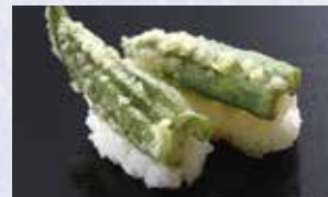
おくら天ぷら 税込240円