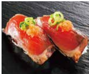
薫焼きかつお葱もみじ 税込390円