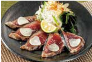
藁焼き かつおたたき たっぷり 薬味のせ(小) 税込750円