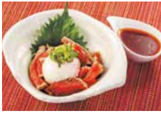
かつおユッケ 税込580円