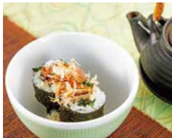
かつお土佐巻 だし茶漬け 税込580円