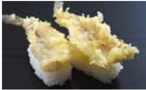
きす天ぷら 税込350円