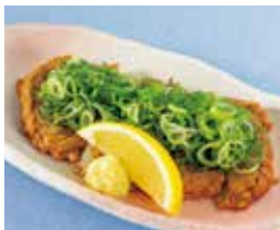
愛媛のじゃこ天 葱まみれ 税込480円