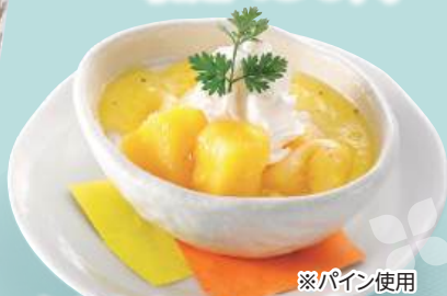
※パイン使用 もちもちミルクプリン 税込430円