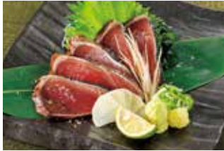
藁焼き かつお 塩たたき お造り 税込750円