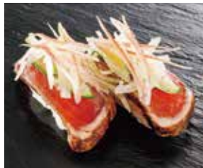
薫焼きかつお薬味のせ 税込390円