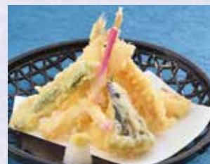
きす天ぷら一品 税込680円