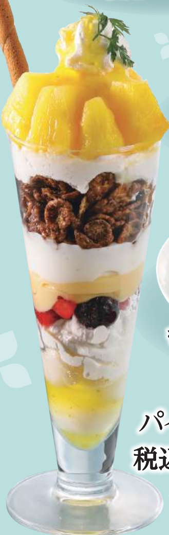
パインパフェ 税込880円