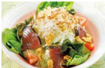
かつお チーズ海苔天 カリカリサラダ 税込650円