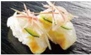
ひらめ昆布メ宇治抹茶仕立て 薬味のせ 税込580円