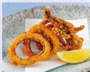
いか唐揚げ 税込380円