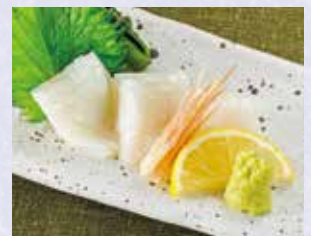
するめいか糸造り 税込880円