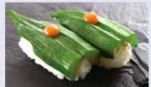
おくら梅肉 税込190円