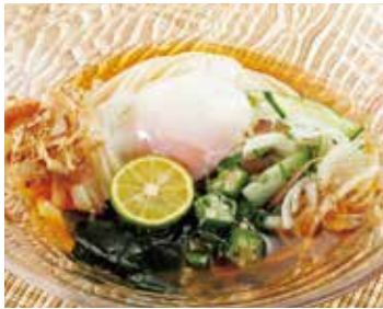
初夏 ぶっかけ 冷やしうどん 税込480円