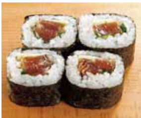
薫焼きかつお土佐巻 税込490円