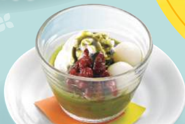
抹茶水ようかん 税込430円