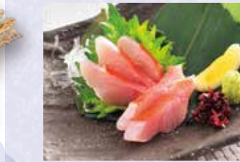
金目鯛お造り 税込1,480円