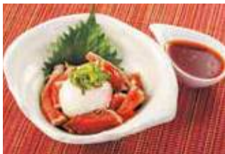
かつおユッケ 税込580円