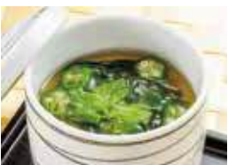
オクラ モロヘイヤ 季節の茶碗蒸し 税込430円