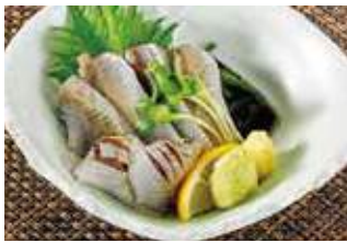
真いわし お造り 税込580円