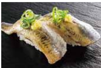
真いわし葱しょうが 税込350円