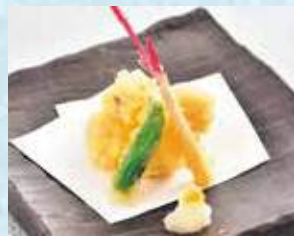
はも天ぷら一品 税込980円