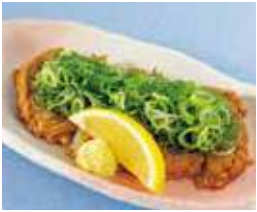
愛媛のじゃこ天 葱まみれ 税込480円