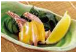
するめげそと 鳴門わかめの酢の物 税込480円