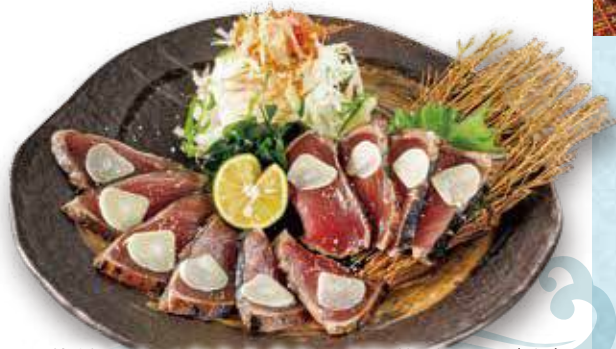
薬焼きかつおたたきたっぷり薬味のせ(大) 税込1,480円