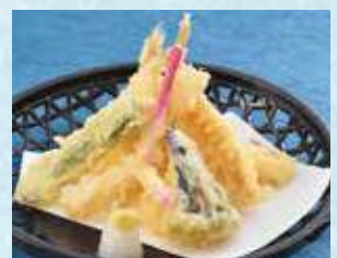
きす天ぷら一品 税込680円