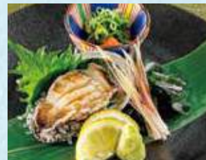
活あわびお造り薬味添え 税込790円