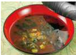
おくらモロヘイヤと 鳴門わかめの赤だし 税込380円