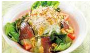
かつお チーズ海苔天 カリカリサラダ 税込650円