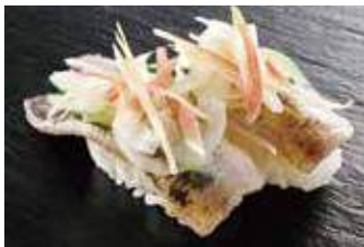
真いわし薬味のせ 税込350円