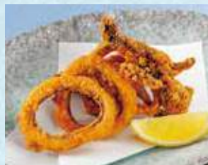
いか唐揚げ 税込380円