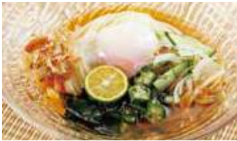
初夏 ぶっかけ 冷やしうどん 税込480円