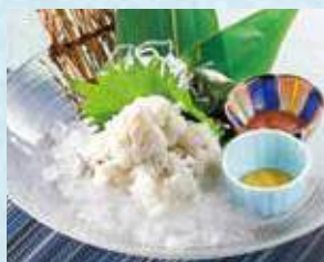
はもおとし 税込980円