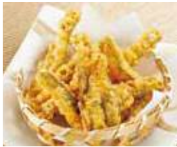
チーズ海苔天スナック 税込380円