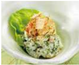
あおさの入った季節の ポテトサラダ 税込380円