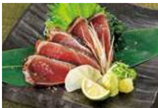
薬焼き かつお 塩たたき お造り 税込750円