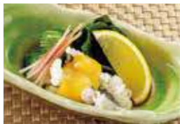
炙りはもと 鳴門わかめの酢味噌 税込730円