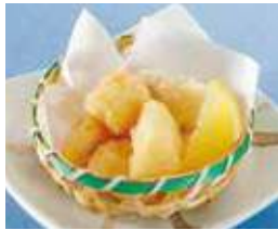
マンボウ唐揚げ 税込480円