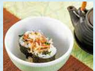
かつお土佐巻だし茶漬け 税込580円