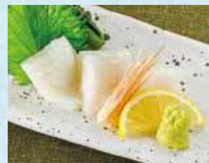
するめいか糸造り 税込880円