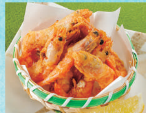
小海老の唐揚げ 税込580円