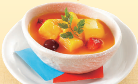
マンゴー杏仁プリン 税込430円