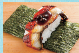
国産うなぎ手巻き(実山椒) 税込440円