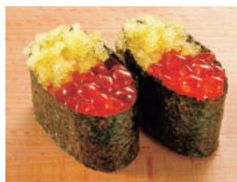
いくら数の子 税込490円