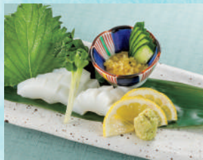
紋甲いかお造り 税込880円