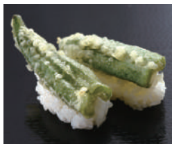
おくら天ぷら 税込240円