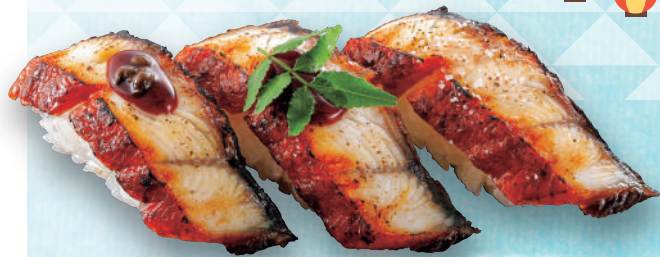
国産うなぎ三貫 税込980円