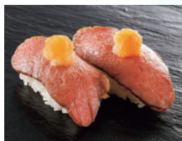
【九州産】黒毛和牛 小豆島ポン酢 税込650円