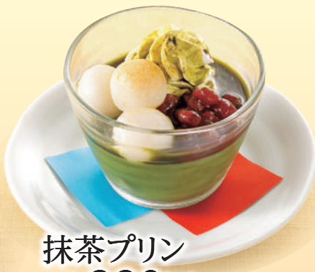
抹茶プリン 税込380円