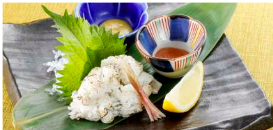
炙りはも一品 税込980円