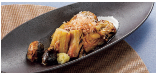
焼きなす一品 税込380円