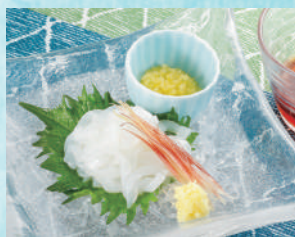
いかそうめん(つゆ) 税込490円