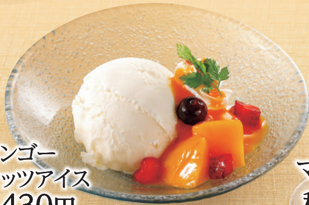
マンゴー ココナッツアイス 税込430円