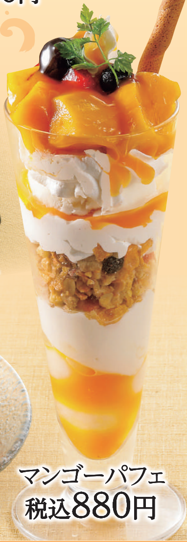
マンゴーパフェ 税込880円