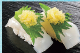
紋甲いか数の子のせ 税込490円