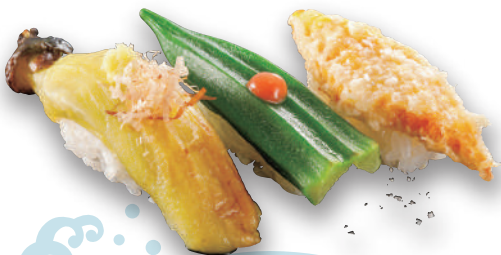
夏野菜三昧 税込350円 焼きなす・おくら梅肉・とうもろこし天ぷら