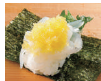
いかそうめん 数の子手巻き 税込290円

※ご提供皿販売価格は、店舗により異なります。 ※天候・漁場の都合により、内容変更やご提供できない場合がございます。ご了承くださいませ。 ※漁場の都合により仕入れ産地が異なる場合がございます。