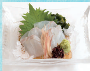
すずきお造り 税込1,280円