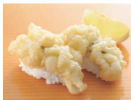
はも天ぷら 税込650円