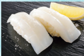
紋甲いかレモン塩 税込440円