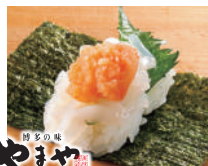
いかそうめん 明太子手巻き 税込290円