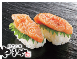
炙り明太子 税込350円