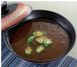
もずく赤だし 税込380円