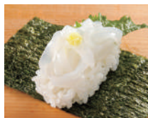
いかそうめん手巻き 税込240円