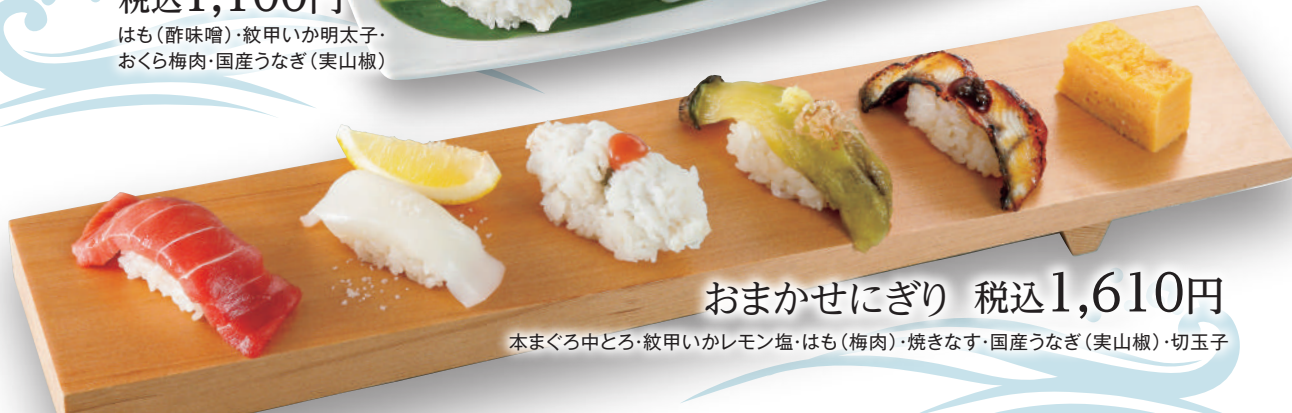
おまかせにぎり 税込1,610円

本まぐろ中とろ・紋甲いかレモン塩・はも(梅肉)・焼きなす・国産うなぎ(実山椒)・切玉子