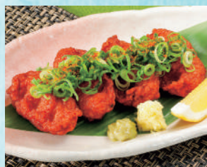
さつま揚げ 税込480円