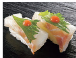
すずき梅しそ 税込490円