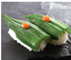
おくら梅肉 税込190円