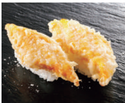
とうもろこし天ぷら 税込240円