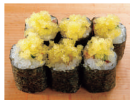
梅しそ巻数の子のせ 税込440円