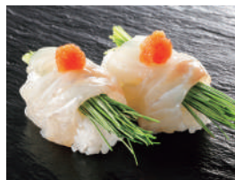
すずき芽ねぎ 税込490円