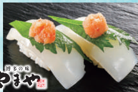
紋甲いか明太子 税込490円