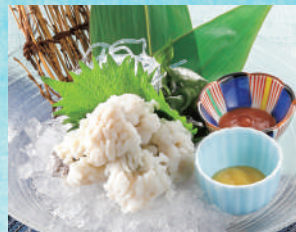
はも落とし 税込980円