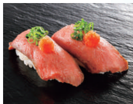
【九州産】黒毛和牛 葱もみじ 税込650円