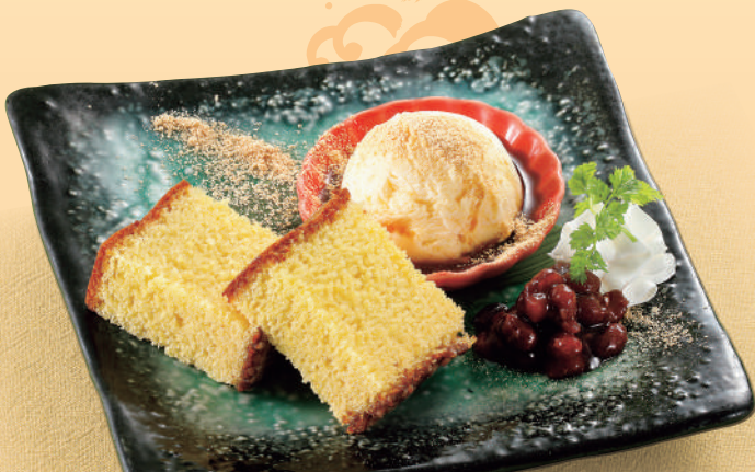
長崎カステラ バニラアイス添え 税込480円