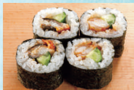
国産うなぎ手巻き(実山椒) 税込440円